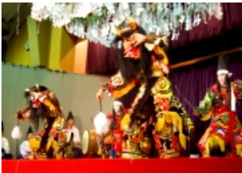
飯南神楽同好会による「羅生門」

橋)飯南神楽同好会(大蛇)など、熱のこもった八演目が披露されました。また、各種団体による「バザー」も出店され、「焼き鳥」「カレー」「おむすび」などが並び、美味しい物を食べながら神楽に酔いしれる一夜となりました。