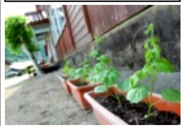
ゴーヤのカーテン成長中

神楽共演大会も無事に終え一段落というところですが、記録的な空梅雨で作物に被害がでないかと心配です。行事の多いこの季節、暑い日が続きますので熱中症には気を付けて過ごしましょう。