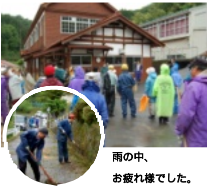
雨の中、お疲れ様でした。

今年も谷笑楽校周辺の一斉清掃が二日(日)に行われました。当日は冷たい雨が降っていましたが、早朝より約八十名の方に参加して頂き、短時間で大変きれいにすることができました。地域住民全体で作業をすることが意味深いことだと参加者一人一人が感じられたのではないのでしょうか。地区によっては、一日清掃活動をされたとか、大変お疲れ様でした。