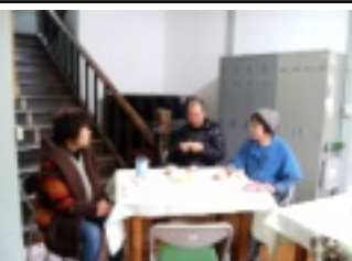
参加者同士会話も弾みます

今年初となる「谷のカフェ・メルシ」が一月二十二日(火)開催されました。今月のお菓子は「ガレットデロワ」と言う、中におもちやが入っており当たった人は王冠が渡され一日祝福されるといふもの。参加者達はドキドキしながらお菓子を食べ、久しぶりの再会に喜び、歓談されています。毎月開催していますので温かい珈琲を飲み是非お出かけ下さい。