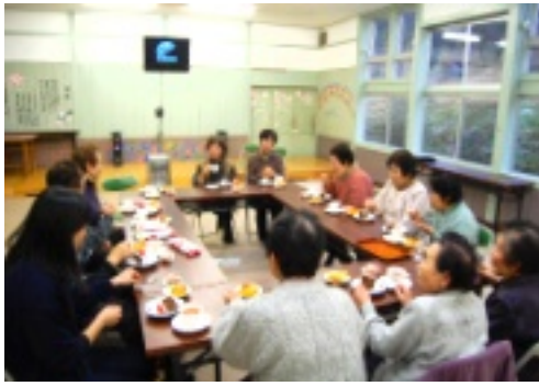
ケーキを食べながら、和やかなひととき

毎月第一月曜日に、様々な教室や研修など幅広い活動をされている「いきいきサロン」が、二月四日(月)に谷笑楽校に於いて開催されました。今回は誕生日会という事で、はじめてカラオケ大会が行われ、懐かしの歌が校舎内に響き渡りました。その後、手作りの誕生日ケーキが登場、ろうそくに火を灯して誕生日を迎えられた三人のお祝いをしました。おいしいケーキを食べながら、和やかな雰