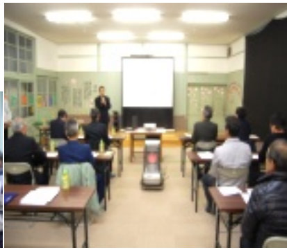
真剣な様子で意見交換

二月四日(月)興出雲町三成連合自治会と興出雲町地域振興課より計十一名の方が谷地区の視察に来られました。特に輸送活動について数多くの質問があり、澤