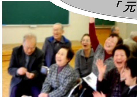
会場は笑顔でいっぱい!

二月六日(水)谷老人クラブ「健康教室」が谷公民館にて行われました。保健師さんからは、健康への秘訣について楽しみながら学び、音だけで物を当てるユニークなレクリエーションも交え、会場は大変盛り上がりました。午後から、血圧や屈伸力、片足立ちや握力の測定など「健康測定」が