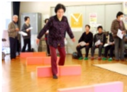
皆さんとっても元気!

あとかぎ 厳しい寒さが続くと思いきや、春並みの気温となったりと、気まぐれな天候が続きますね。インフルエンザも流行しているようです。気温の変化に気を付けながら、近づきつつある春の訪れに耳を傾け、季節の変化を楽しみたいと思います。