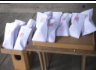
参拝者を待つ福豆