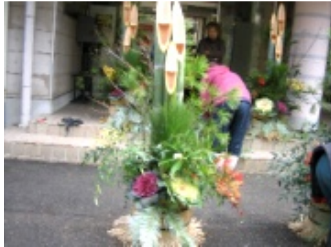
仕上がりはいかがでしょう