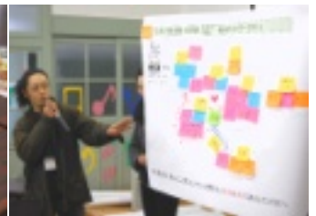
協力隊のプレゼン中

十二月五日(水)「まげな谷づくり(谷地区住みよい地域創造事業)」の役員会が開かれ、今後の計画等について話し合いを行いました。中には、ゆずの加工食品の生産など、すでに活動を開始したグループもあります。今後様々な活動が期待される「まげな谷づくり」です。皆さんも色々なグループへ参加をしてみ下さい。詳しくは、谷笑楽校までお問い合わせ下さい。