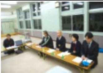
県からも心強いサポート