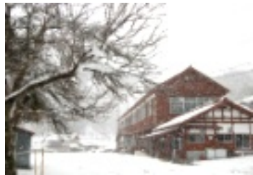
白世界に一変です