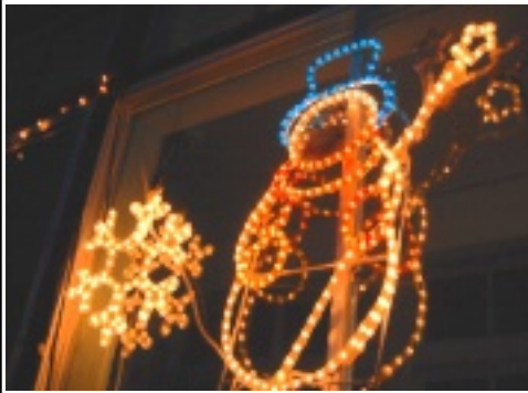
愛嬌たっぷりの雪だるま

十二月に入り、いよいよ今年も残すところあと僅かとなりました。毎冬恒例である谷笑楽校のイルミネーションの取り付けが、総務振興部の皆さんの協力で行われまして。校舎一面に裝飾された柔らかな光が、谷地区の寒い冬を温かく包み込みます。空を見上げれば