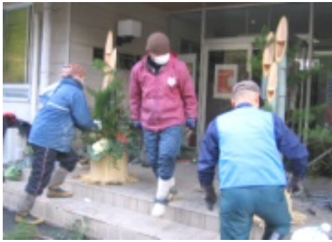
門松作成中の様子

十二月八日(土)谷公民館ました。来年も「公民館頑主催「門松作り」が今年張るゾ！」と参加者から声も行われました。材料の調達は出来ていたもののが...是非見に来てくださ