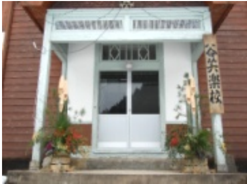
楽校の校門前に堂々と

一年とバージョンアップ(参加者談...)完成した門松は、谷公民館と谷笑楽校前に飾られています。立派な門松と共に今年最後の事業が終了。地域ではすでに新たな年を迎える準備が出来