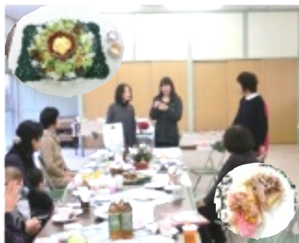
にぎやかなカフェのはじまり...*

十二月五日(水)谷笑楽校にて「谷のカフェ・メルシ」クリスマススペシャルが子供さん連れや近所の方など約15名の参加で開催されました。今回は一人一品持ち寄り、オープンサンドを食べながらのカフェ。テーブル一杯に並べられた様々なトッピングを目の前に会話も弾み、終始にぎやかな様子。バザーに、サプライズプレゼント、クリスマスソングを合唱しながらと盛りだくさんの内容でした。笑楽校に一足早いサンタがやってきました。