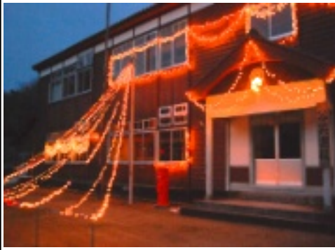
点灯は午後5時～8時30分まで

十二月に入り、いよいよ今年も残すところあと僅かとなりました。毎冬恒例である谷笑楽校のイルミネーションの取り付けが、総務振興部の皆さんの協力で行われまして。校舎一面に裝飾された柔らかな光が、谷地区の寒い冬を温かく包み込みます。空を見上げれば