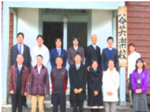
全国地域リーダー養成塾の皆さん

十一月十九日(月)地域活性化センターより「全国地域リーダー養成塾」の皆さんが谷地区へ視察に來られました。始めに程原地区の見学を行い、谷の豊かな恵みで育った美味しいや