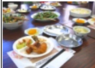
思わず笑顔に「谷笑給食」