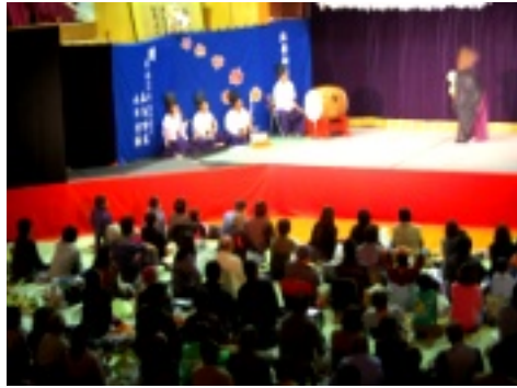
会場に集まった神楽ファン