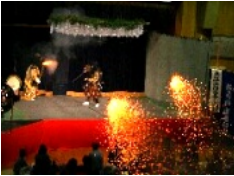
大都神楽団【大江山 酒呑童子】