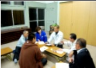
11月7日グループ話し合い