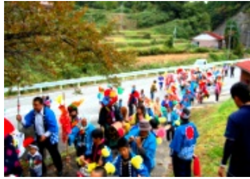
祭囃子が谷間に響く

十月十八日(木)「谷八幡宮例大祭」が開催されました。天候にも恵まれ、着付けの段階より笑顔が溢れ、袖を通した子どもたちは引き締まった表情に。昼過ぎには塩谷・井戸谷・畑田各地区よりお宮に向けて楽打奉納が始まり、色鮮やかな衣装と、年齢性別を問わず息のピタリと合った祭囃子が谷間を飾ります。55号線を通る車も立止まり、表情を輝かせて写真を撮る姿もみられました。