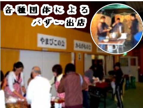
各種団体出店の様子

会場では「谷青年協議会」「やまびこの会」「かきもの会」の各種団体の皆さんによるバザーが出店されました。うどん・おむすび・おでんなどの美味しいものがたくさん並び、温