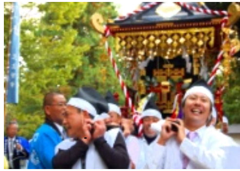
参加者全員が素敵な笑顔

十月十八日(木)「谷八幡宮例大祭」が開催されました。天候にも恵まれ、着付けの段階より笑顔が溢れ、袖を通した子どもたちは引き締まった表情に。昼過ぎには塩谷・井戸谷・畑田各地区よりお宮に向けて楽打奉納が始まり、色鮮やかな衣装と、年齢性別を問わず息のピタリと合った祭囃子が谷間を飾ります。55号線を通る車も立止まり、表情を輝かせて写真を撮る姿もみられました。