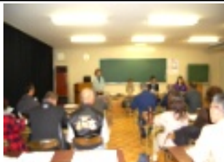
10月29日説明会の様子

今年度より三カ年計画で「谷地区住みよい地域創造事業」に取り組みにあたり十月二十九日(月)第一回事業説明会が開かれ、県・町の職員また谷自治振興会役員から概要や趣旨についての説明がありました。十一月七日(水)には第二回として詳しい内容の話し合いが行われました。グループで出した意見を元に、少しずつ動き始めました。「まげな谷づくり」と命名!