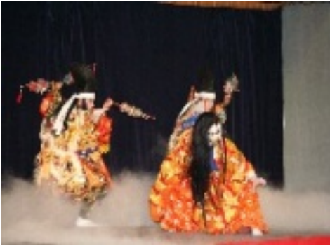
飯南神楽同好会【悪狐伝】

十月二十七日(土)「第二回ふれあい神楽交流大会」が谷体育館で開催されました。「海潮山王寺神楽」(雲南市)、「大都神楽団」(江津市)、「飯南神楽同好会」による計七演目が舞われ、約二百人のお客さんと六月とは少し違ったゆったりとした雰囲気の中、秋の夜神楽を存分に満喫しました。