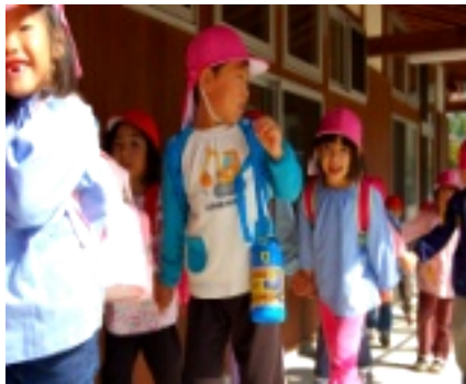
「こんにちは~!」と元気いっぱい!

境内に到着し全地区が合流すると、いよいよ盛大な霧囲気に包まれ、年祭りや御神輿が担がれ、谷地区の皆さんの無病息災とさらなる発展が祈願されました。夜からは谷八幡宮にて、飯南神楽同好会による神楽も行われ、普段とは一味も二味も違う舞にただただ見惚れるばかりでした。朝から晩まで飲んで笑って踊つてと、谷地区の深い歴史を感じつつ、大変賑やかなお祭りとなりました。