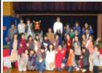
参加者の皆さんとハイポーズ「重~い!」「かっこいい!」