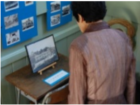
「あれは誰だかいいえ～…」

使用した「やまめ弁当」が机に並び、一方ステージでは、「相撲甚句会」による迫力ある相撲甚句、「かるがもの会」による銭太鼓が披露され、お楽しみ品の飯南町の特産品が当たる「実りの秋プレゼント抽選会」も行われ、谷小学校卒業生会は大変に賑やかな会となりました。