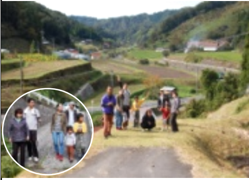
塩谷の景色をバックに

「谷めぐりプラス」アロママッサージとポプリ作りが開催されました。秋風心地よい天候の中、早速風心地の良いとコスボット谷地区の良いとコスボットを巡りに出掛けました。まずは畑田の発電所へ。周りの透き通った水の流れと渓谷の景色に驚かされました。続いて地域が一望出来る場所から一帯を眺めたりと、普段はなかなか足を留めて見ない景色に参加者の皆さんも満足していた様