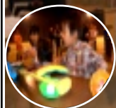
予選には参加者が少