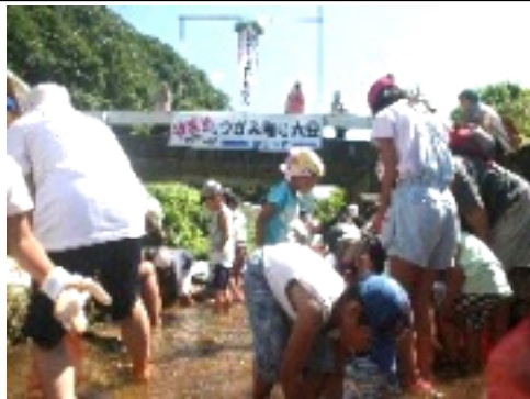
やまめ見つかるかな?

今年で第25回を迎える谷公民館主催「やまめのつかみ取り大会」が七月二十九日(日)塩谷川に於いて開催されました。祝!25回の記念にくす玉が登場クラッカーと風船と共に賑やかに開会されました。今年も百人近い参加者で、子供達は元気に川へ入り約三百匹のやまめを一生懸命捕まえていました。早速計測所へ持ってきては、満足げな様子。お昼は体育館へ移動し谷青年協議会の皆さんが焼いて