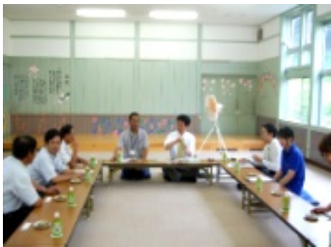
意見交換会で交流

町・地域それぞれの立場から、今後の地域活性化の在り方についての意見交換や協力隊の活動状況についての報告を行いました。また手作りの「しそジュース」と「しば餅」が振る舞われ、皆さんに大変喜んで頂きました。長時間にわたる対応で終始緊張の連続でした。