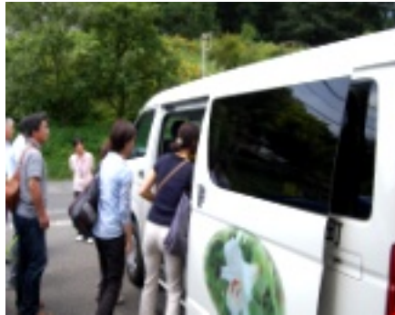
せせらぎ号見学の様子

七月二十四日(火)東広島市福富町より十八名の方が谷地区へ視察に来られました。福富町では高齢化に