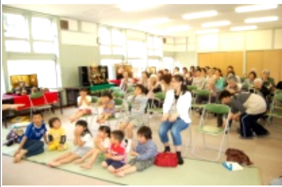
飾られた会場に集まった皆さん

五月二十七日(日)谷笑楽校を会場に谷婦人会主催・育児サロン「こがもちゃん」共催「鄙の里の端午の節句」が開催され、約50名が参加しました。大型紙芝居、子供達による銭太鼓、合唱、大正琴、仏教歌、谷婦人会による出しものなどに披露されました。柏餅を頂き、会場一杯に飾られた雛人形等を眺めながら季節を感じる楽しいひと時となりました。