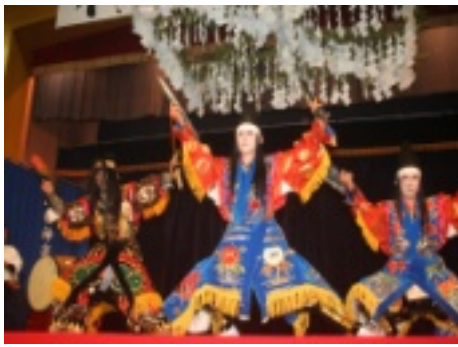
飯南神楽同好会『山姥』