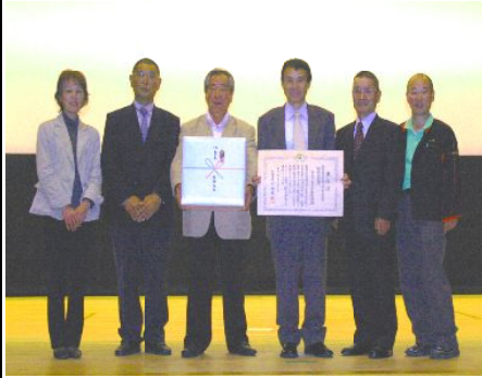
谷自治振興会 役員

すでに広報や新聞等で紹介されておりすが、平成23年度過疎地域自立活性化優良事例表彰」に於いて谷地区の取り組みが総務大臣賞を受賞致しました。十月十三日・十四日と愛媛県西予市で行われた「全国過疎問題シンポジウム2011 三えひめ」に谷自治振興会の役員六名が出席し、表彰式に参加しました。また、翌日には第二分科会に於い