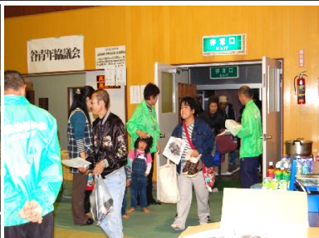
来場者を迎えるスタッフ

測がつかない部分もありましたが、スタッフも含め沢山の方のご協力・ご支援をいただき無事に終えることが出来ました。次回は六月「泥おとし神楽共演大会」でお会いしましょう！