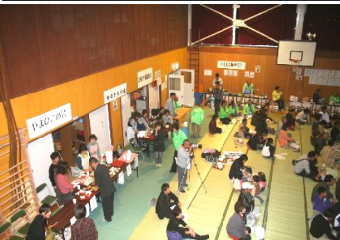
各種団体の皆さんによるバザー

会場では谷青年協議会、やまびこの会、かるがも会の皆さんによるバザーもあり、即売の盛況ぶり。初めての開催で予