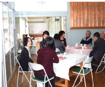
カフェでなごむ皆さん