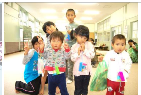
お菓子を貰って嬉しそう