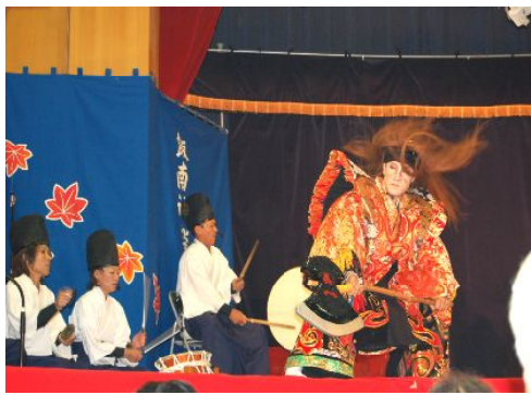
飯南神楽同好会『山姥』