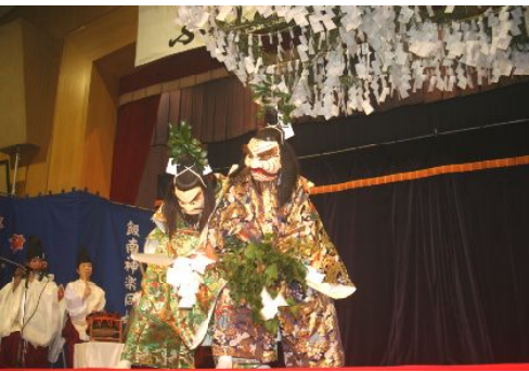
深野神楽保存会『国譲』