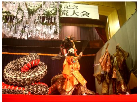
温泉津舞子連中『大蛇』

会場では谷青年協議会、やまびこの会、かるがも会の皆さんによるバザーもあり、即売の盛況ぶり。初めての開催で予