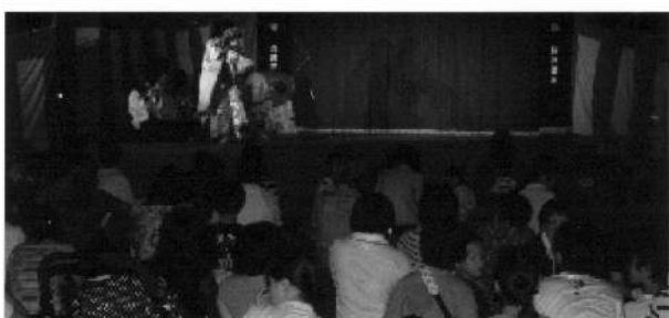
飯南神楽同好会による「悪狐伝」

した。最終には、ビンゴゲームや、真上に上がる花火を見ながら余韻を残し帰宅しました。ご協力をしてくださいました皆様ありがとうございました。