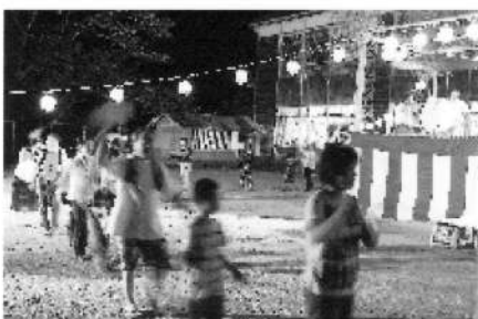
ヤ〜ハトナ〜♪や〜はとな〜え♪