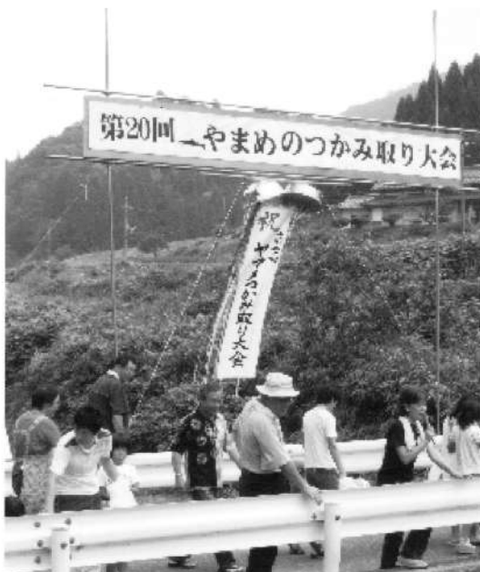
橋の上から実況中継