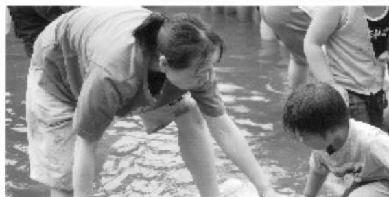
「そこ」「そこ」「そこに」大きいのが