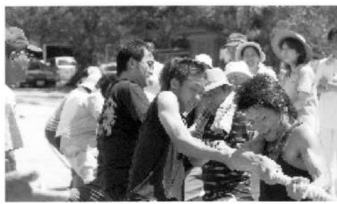
ワッショイ！ワッショイ！

八月二六日第五八回谷地区町民体育大会が晴天の中、旧谷小学校グラウンドに於いて行われました。今年度は、新しい種目もあり、地域の人が一同に集まり、楽しい中にも熱戦が繰り広