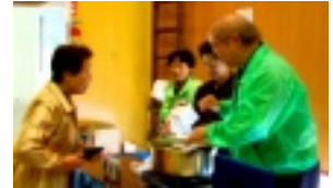
大盛況の地域の皆さんによる協賛バザー！