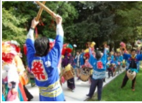
綺麗になった参道での楽打ちの様子

十月十八日(金)「谷八幡宮例大祭」が開催されました。雨の日が続いていましたが、当日は天候にも恵まれ、澄んだ青空の下で、色鮮やかな衣装と賑やかな楽打ちが谷間を彩りました。鳥居の前で全地区が集合し、新たに改修工事がされた参道では、楽打ちがよりいっそう美しくみえました。境内では楽打ちの奉納が盛大に行われた後、年祭りや御神輿が担がれまし