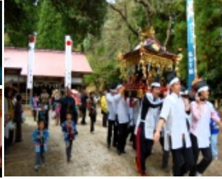
朝から晩まで楽しく賑やかな一日となりました。