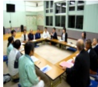
各グループとも活動の中心が濃くなりました。

十月二十三日「まげな谷づくり」の全体会が行われ、各グループの活動報告及び意見交換が行われました。今回は中山間地域研究センターよりマイクロ水力発電の専門員、地域支援スタッフのみなさんも参加して頂き、アドバイス等を受