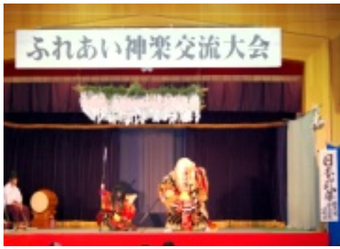
高校生とは思えない気迫の演技！

第三回「ふれあい神楽交流大会」が十月二十七日に開催されました。神楽といえば夜のイメージが浮かびますが、今大会は昼間での開演。町内でも各種イベントが多い中、たくさんの方に来場して頂きました。石見神楽亀山社中による「塩被」から始まり、新庄高