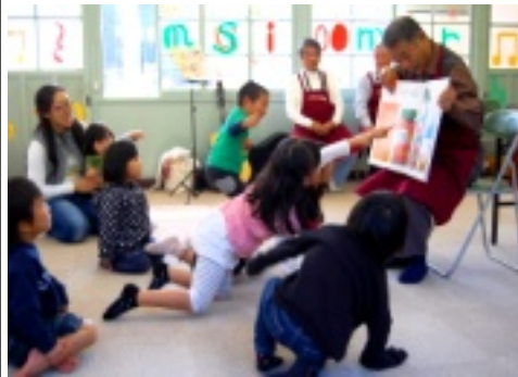
グランパの読み語りに子ども達は釘づけ

二日(土)二輪草の会主催「グランパ in 雲南」によるイベントが谷笑楽校で開催されました。絵本の読み語りや紙芝居、マジックショーなどが元気なグランパ達によって披露され、大人も子どももお腹を抱えて笑い、和やかな雰囲気でした。また、間が過ぎました。また、谷婦人会の皆さんによるバナナケーキと紅茶のおもてなしも。久しぶりに笑楽校に笑い声が溢れる一日となりました。