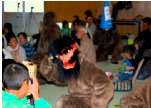
石見神楽亀山社中による「頼政」

第三回「ふれあい神楽交流大会」が十月二十七日に開催されました。神楽といえば夜のイメージが浮かびますが、今大会は昼間での開演。町内でも各種イベントが多い中、たくさんの方に来場して頂きました。石見神楽亀山社中による「塩被」から始まり、新庄高