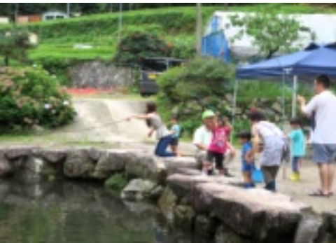
やまめ釣りを楽しむ子どもたち

この夏も清流クラブにより「ふれあい養魚場」が八月十六日・二十三日にプチオープンしました。あいにくの雨でしたが遠方からのお客さんも来られ、自然と触れ合いながらやまめ釣りができ、大変喜んで頂くことができました。今月二十八日(日)に行われる「秋の感謝デー」で今年の釣り堀の営業は終わり。みなさんも美味しいやまめを食べに、ぜひ足を運んでみてください。