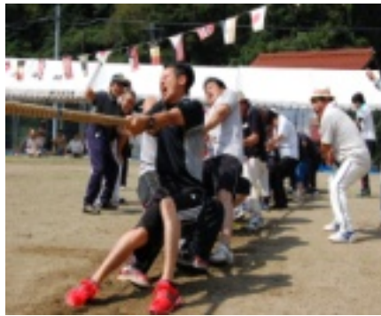
迫力満点の綱引き競技!

谷、惜しくも3位の井戸谷となりました。大会後には各地区ごとに懇親会が行われ、夜遅くまで盛り上がりがあったところもあつたとか。地域のみなさんの顔が一同に見える行事は町民大会ではないでしょうか?是非、来年も校庭に足を運んで頂きたいと思えます。