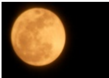
9月9日のスーパームーン

九月に入り朝晩がめつきりと寒くなり、秋を感じる季節となりました。十五夜は見られませんでしたか?各地区で稲刈りも始まったようです。身体には十分に気をつけられ、秋の夜長を楽しみましょう。