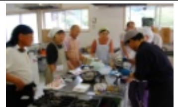
加工室はジャムでいい香り