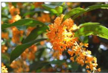
コミセン裏の「金木犀」

10月11日(日)農村公園の草刈り作業が行われました。今回は塩谷地区の皆さんが担当され、23名で朝8時から9時30分までの作業で農村公園やその周辺が大変綺麗になりました。6月は井戸谷、8月は畑田、10月は塩谷と各地区の皆さんにご協力頂き、また、谷老人クラブの皆さんにも公園やトイレの清掃を受託頂き、年間を通じて農村公園が綺麗に保たれました。これからも地域で支えあっていきましょう。