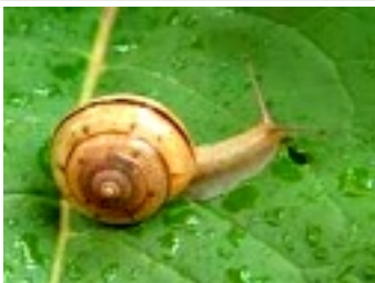
雨に喜ぶカタツムリ

神楽共演大会も無事に終了。え、気付けば梅雨に入りました。日中の気温は高くなりましたが、朝晩はまだ冷えます。気温の変化に気をつけて、行事の多いこの季節を楽しんで過ごしましょう！