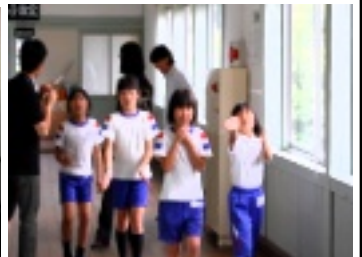
竹トンボ上手く飛ばすかな？