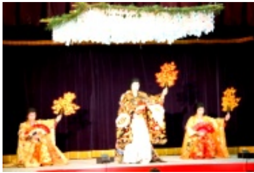
飯南神楽同好会による「紅葉狩」

第十回記念「泥おとし神楽共演大会」が十四日(土)に開催されました。一週間前から会場前には場所取りのイスが並び、当日も朝早くから長蛇の列ができ、開場と同時に四五〇人以上の神楽ファンで埋め尽くされました。各四団体(雲月女性