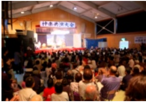
満員御礼！会場は大賑わい！

第十回記念「泥おとし神楽共演大会」が十四日(土)に開催されました。一週間前から会場前には場所取りのイスが並び、当日も朝早くから長蛇の列ができ、開場と同時に四五〇人以上の神楽ファンで埋め尽くされました。各四団体(雲月女性