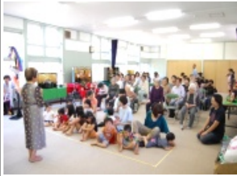
きれいな五月人形が沢山集まりました。

谷婦人会主催・育児サロン「こがもちゃん」共催「鄙の里の端午の節句」が五月三十一日に谷笑楽校で開催され、約八十名の方が参加しました。お茶を頂きながらゆつくりと五月人形を鑑賞した後、大型紙芝居、子供達による合唱、コーラスやダンス、演劇などたくさんのお出し物がステージで披露され、幅広い年代の方々が交流できる楽しい時間となりました。