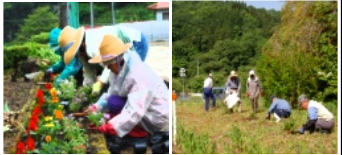
県道や校舎から眺める景色が色鮮やかになりました！

谷老人クラブにより県道の「花道街道」の清掃が五月二十八日に行われ、花壇がきれいに整えられるとともに、校前には紫陽花が植樹されました。また、十三日(金)には谷婦人会の方が、楽校の花壇にマリーゴールドなどの色鮮やかな花の苗を植えられました。小さな活動が谷の美しい景観を作り出しているのだと思います。