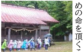
も知ることが出来たと谷探検になったと思います。