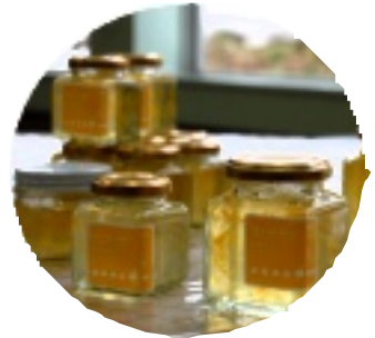
ゆず舟亭の新商品も登場!

また「ゆず舟亭」の新商品のゆずのジャム「ゆずの華」の販売も行われました。ほんのりとした甘さと、ジャムの中に花のように浮かぶ柚子が口の中でさわやかに広がります。アイスやヨーグルトの上にジュレとしてかけるのもおすすめです。是非、お試しください。詳しくは「ゆず舟亭」まで。