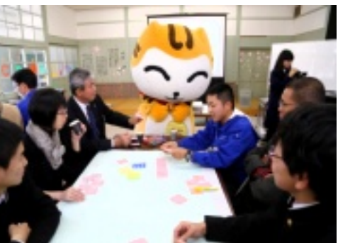
いいにゃんと一緒に考え中...

づくりのワークショップ」が行われました。第一ステージでは、六つのグループに分かれて飯南町が日本一になれるブランド名を考え、第二ステージでは、マスコットキャラクター「いいにゃん」をメディアに注目させる情報発信力を強めるためにはどうすればよいかという課題が出されました。大しめ縄やまといもなどを活かしたユニークで斬新な提案が数々発表され、これまでになかった「まちづくりの新しいカタチ」が見える学び多い一日となりました。