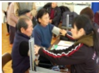
昼食を挟んでから体力測定へ

谷老人クラブ主催「健康教室」が五日(水)に開催されました。初めに保健師さんより「動脈硬化」についての講義が行われ、ヒートショックへの対策や血圧を測る時間など具体的なアドバイスを受けました。その後は「マクラメ人形」作りをして頭の体操をし、午後は驚きを隠せずにはいられます。みなさんの熱いエネルギーを感じる一日でした。