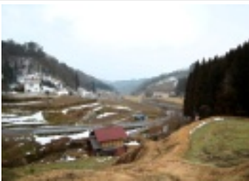
2月に田んぼ見えるなんて...

また「ゆず舟亭」の新商品のゆずのジャム「ゆずの華」の販売も行われました。ほんのりとした甘さと、ジャムの中に花のように浮かぶ柚子が口の中でさわやかに広がります。アイスやヨーグルトの上にジュレとしてかけるのもおすすめです。是非、お試しください。詳しくは「ゆず舟亭」まで。