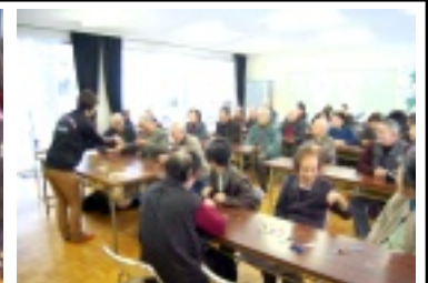
素敵なお人形ができあがり！